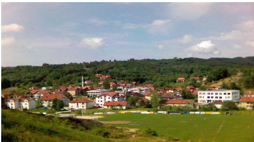
pogled na dio centra Sapne