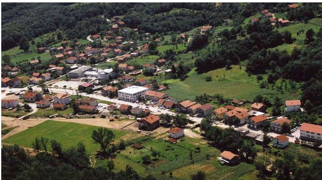
panorama centra Sapne